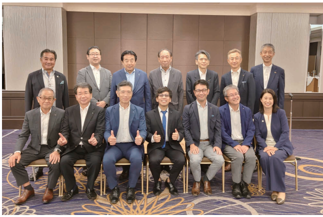
米山奨学生アルさん歓迎会 (7/28)