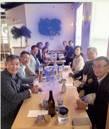
東京城東 RC 昼食会