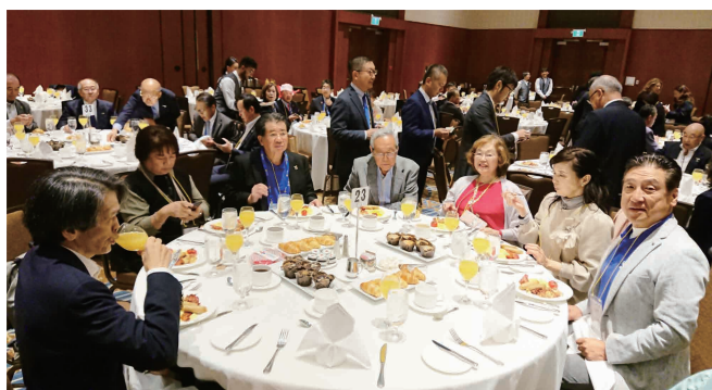
カルガリー国際大会 日本人朝食会