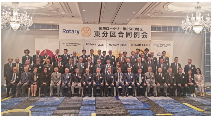
2024/3/15(金) 「東分区分5クラブ合同例会」