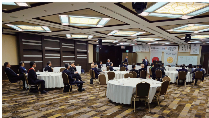
2024/3/4(月) 「第4回クラブフォーラム」 【国際奉仕担当】