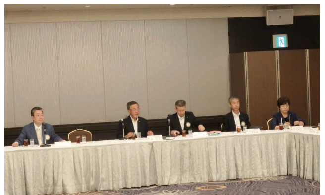
第2回クラブ協議会