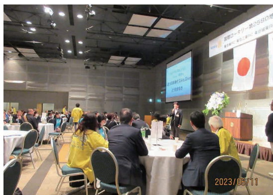
2023/6/11(日) 「5クラブ合同例会」