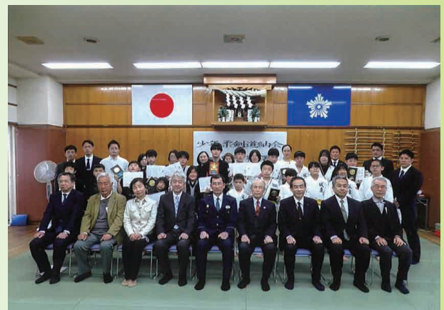
3/18(土) 城東警察署少年柔剣道納会