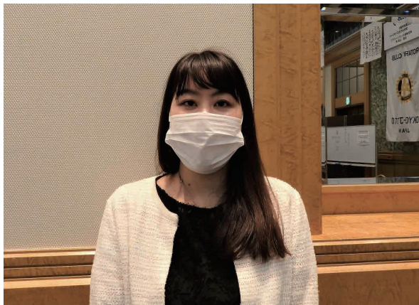
2020/9/28(月) 「第2回クラブフォーラム」 【社会奉仕・職業奉仕担当】